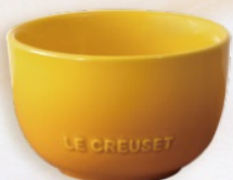
スフィア・ライスボール(ネクター) サイズ(約)直径10.5cm×高さ6.5cm 容量(約)320ml