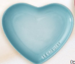
スフィア・ハート・プレート 17cm (ピュリストブルー・ナチュラルピンク) サイズ(約)縦14.5cm×横17cm×高さ2cm