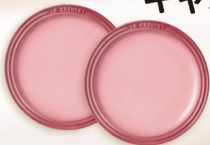
ラウンド・プレート LC 19cm 2枚入り(ナチュラルピンク) サイズ(約)直径19cm×高さ2.5cm